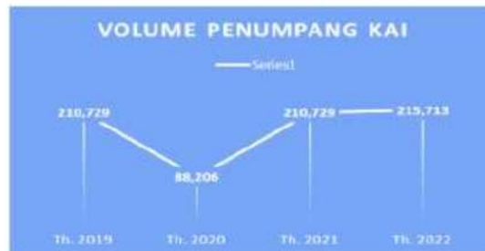
Gambar 4. Perkembangan jumlah penumpang

keduanya mempunyai pengaruh positif dan signifikan terhadap kemudahan pemesanan e-ticketing. Artinya penggunaan aplikasi KAI Access memberikan kemudahan dalam penggunaan dan efektif untuk memesan e-ticketing. Hal ini dikarenakan pengguna jasa kereta api menganggap bahwa dengan adanya aplikasi dan pemesanan tiket melalui e-ticketing memberikan kemudahan pemesanan tiket kereta api. Selain mudah digunakan juga sesuai tujuan pengguna/ efektif karena beberapa kemudahan yang ditawarkan. Berbeda dengan efisien ternyata tidak berpengaruh signifikan. Hal ini ditunjukkan bahwa pengguna aplikasi pemesanan tiket atau calon penumpang merasa bahwa dengan adanya e-ticketing tidak memberikan tawaran harga yang lebih murah artinya harganya sama dengan memesan tiket secara manual.