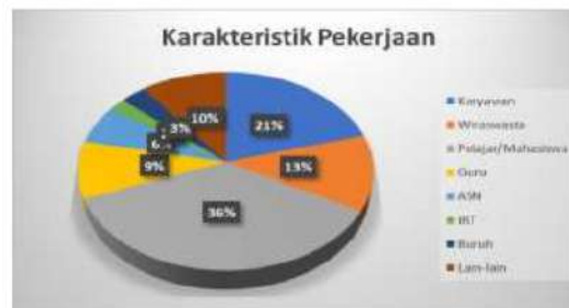
Gambar 3. Karakteristik pekerjaan responden

Gambar 2 menunjukkan persentase responden berdasar usia, dimana pengguna aplikasi e-ticketing untuk memesan tiket kereta api paling banyak didominasi usia 20-25 tahun kemudian usia 35-40 tahun, sedangkan selebihnya menyebar mulai dari usia 16 sampai 45 tahun. Sedangkan karakteristik responden berdasar pekerjaan dapat dilihat pada gambar 3 dibawah yaitu: